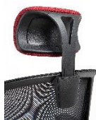
APORL Appoggiatesta regolabile in altezza imbottito e rivestito