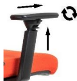
CPBR 360 Bracciolo regolabile in altezza e traslabili con pad morbido e rotazione 360°